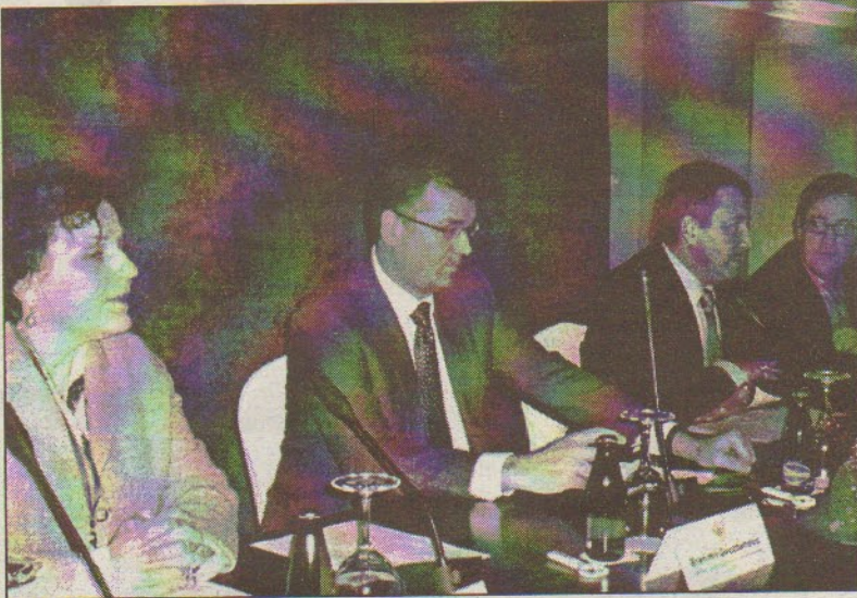
ЗАШТИТА ОСАМ ЛОКАЦИЈА: Скуп експерата у Будви

Будва - Захваљујући успјешном координираном ангажовању и финансијским средствима црногорске владе и Програма УНДП, као и помоћи холандске и чешке владе, Мојковац постаје модел у региону за успјешно рјешавање еколошких проблема - рекао је министар уређења простора и заштите животне средине Бранимир Гвозденовић на регионалном експертском састанку у оквиру програма УНДП за земље Западног Балкана. На овом скупу у Пржну представљена су достигнућа овог програма, разматрани изазови и приоритети на националним нивоима у вези